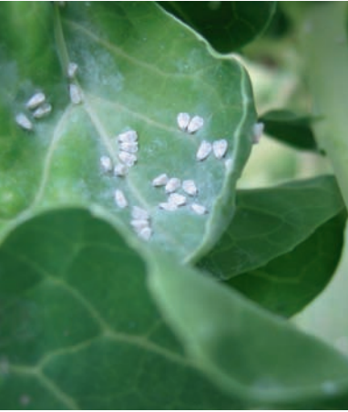
Abb. 2.25: Weiße Fliege.