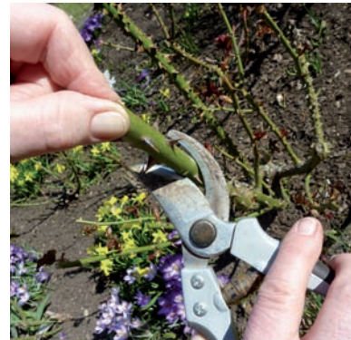
Abb. II.1: Rosen erhalten nach dem Rückschnitt im Frühjahr vorbeugend Arnica .