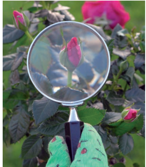
Abb. 1.7a: Kontrolle des Befalls.